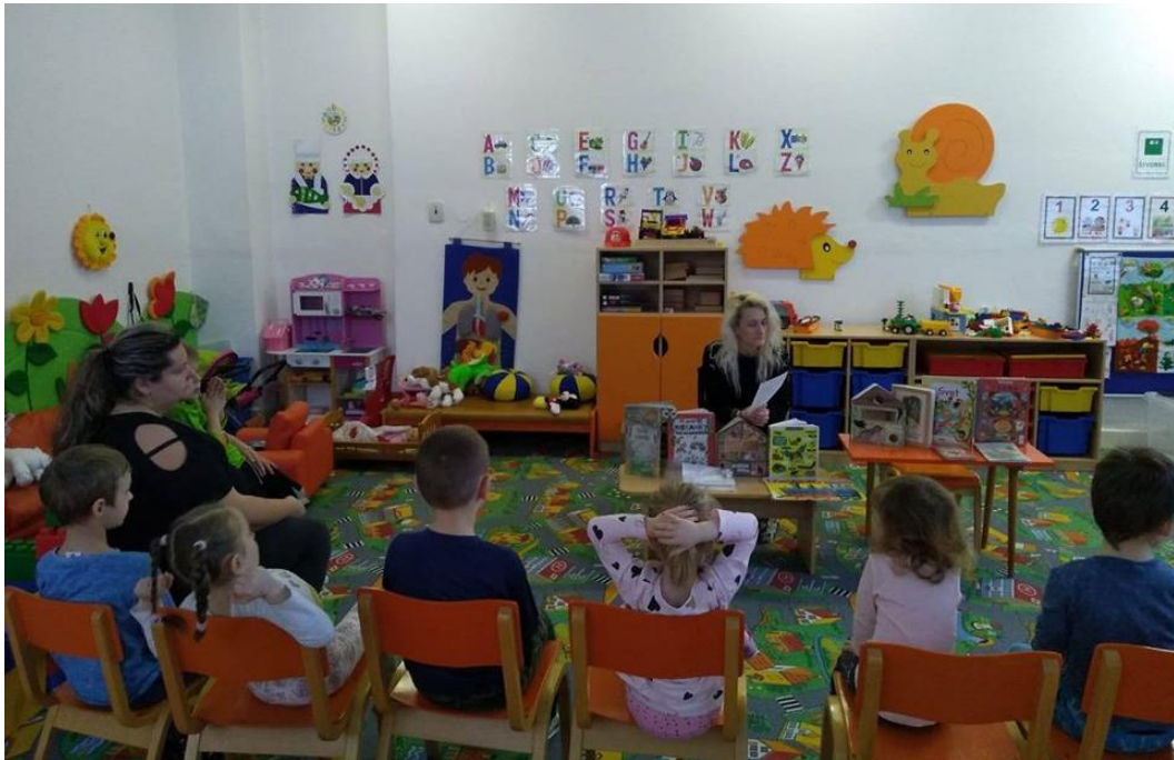
Knižná informatika pre MŠ Šebeš'anová počas Týždňa slovenských knižníc