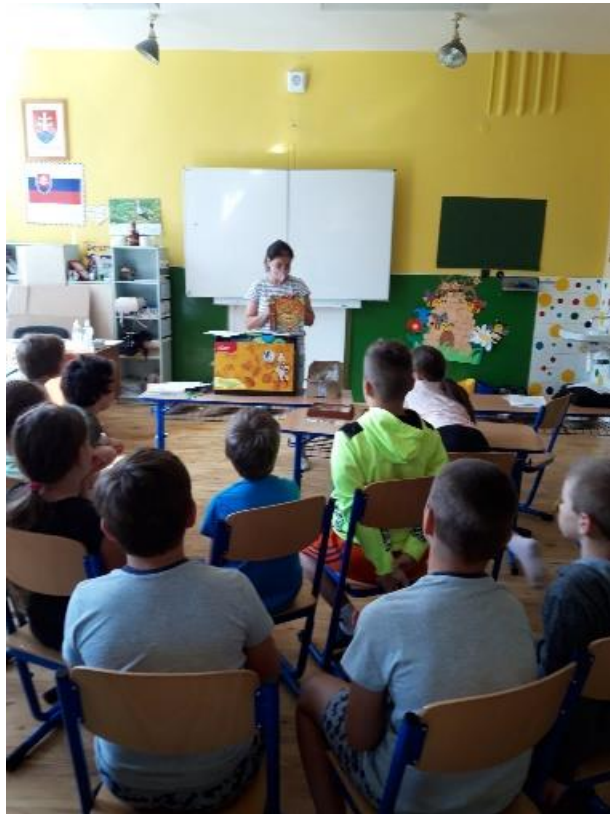
Edukačná pomôcka Hávedník v Letnej škole na Základnej škole Lánka