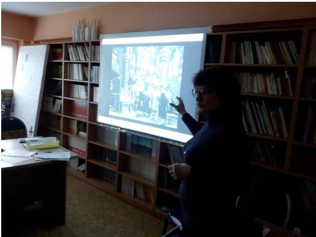
Literárna hodina ku knihe Cesta na Mesiac od Julesa Verna v ZŠ Považská Teplá počas Týždňa slovenských knižníc