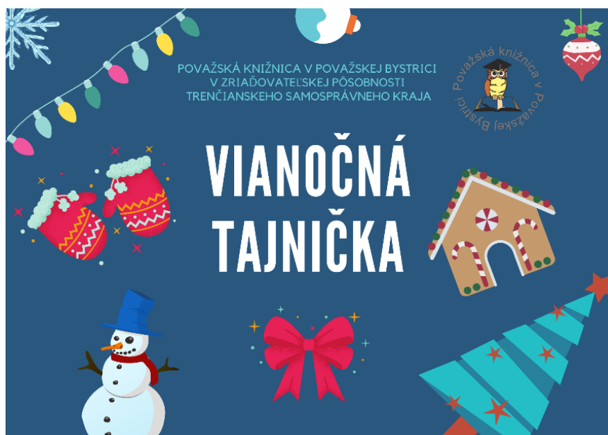
Vianočná tajnička – koncoročná online tajnička pre našich priaznivcov