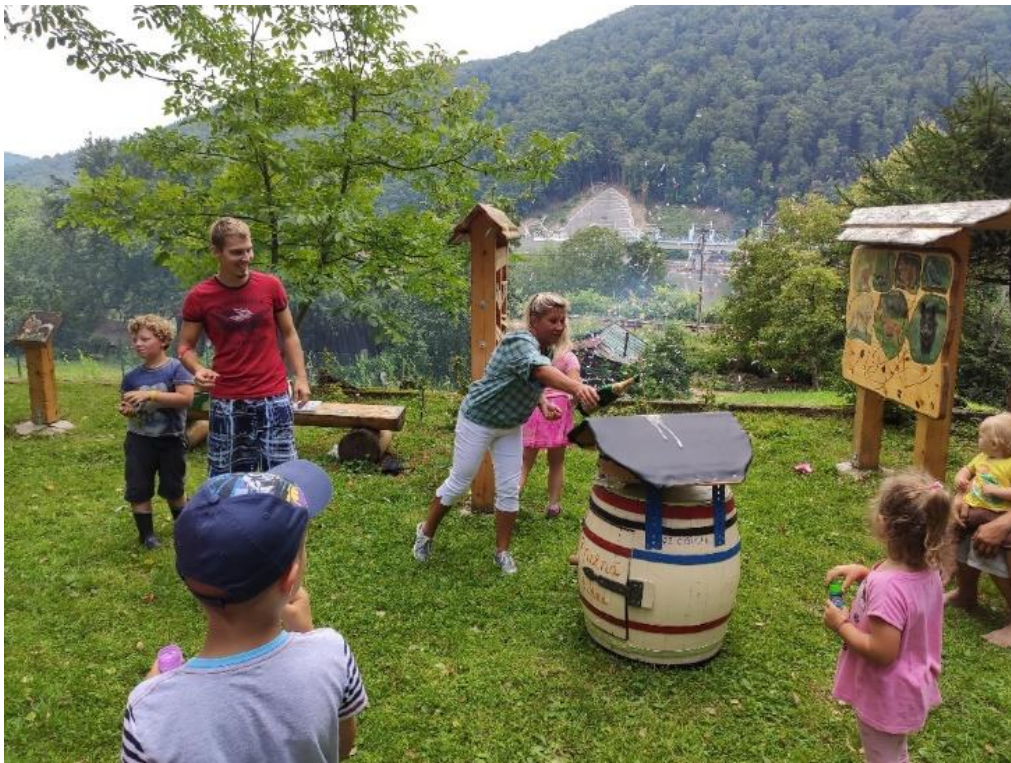
Otvorenie knižnej búdky v Milochove