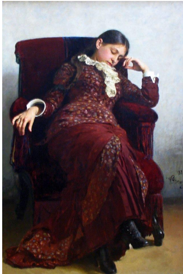
Portrait of Vera Repina, the artist's wife by Ilya Repin, 1882 Oil on canvas ; 143 x 94 cm Tretyakov Gallery, Moscow

Verí, že sen ju nepodvedie a akáže to bude sláva! Zatiaľ niet odtiaľ odpovede, no sníva, snívať neprestáva.